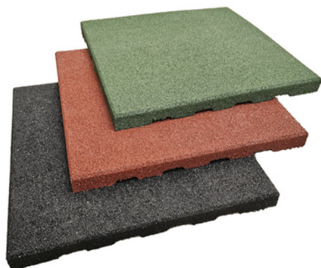
LOSETA DE CAUCHO 40MM TACO DE APOYO 50X50 CM - 6,5 KG